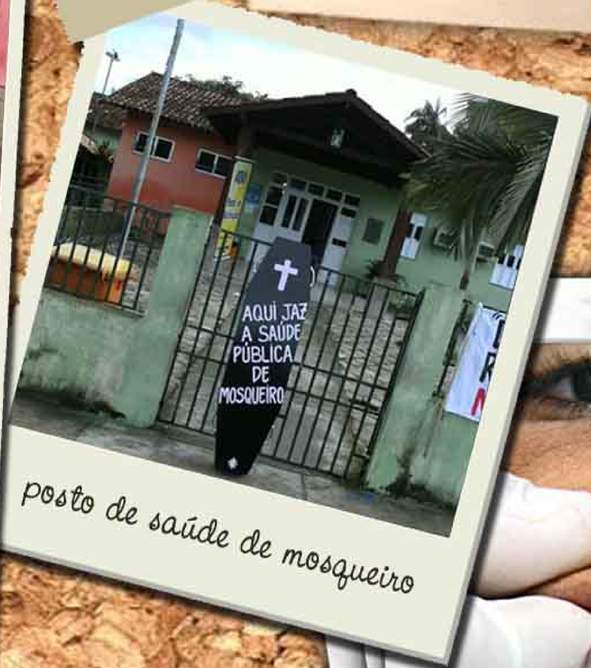
posto de saúde de mosqueiro