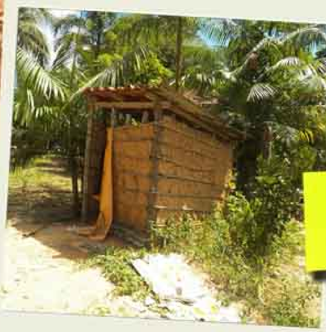
lado de fora do banheiro