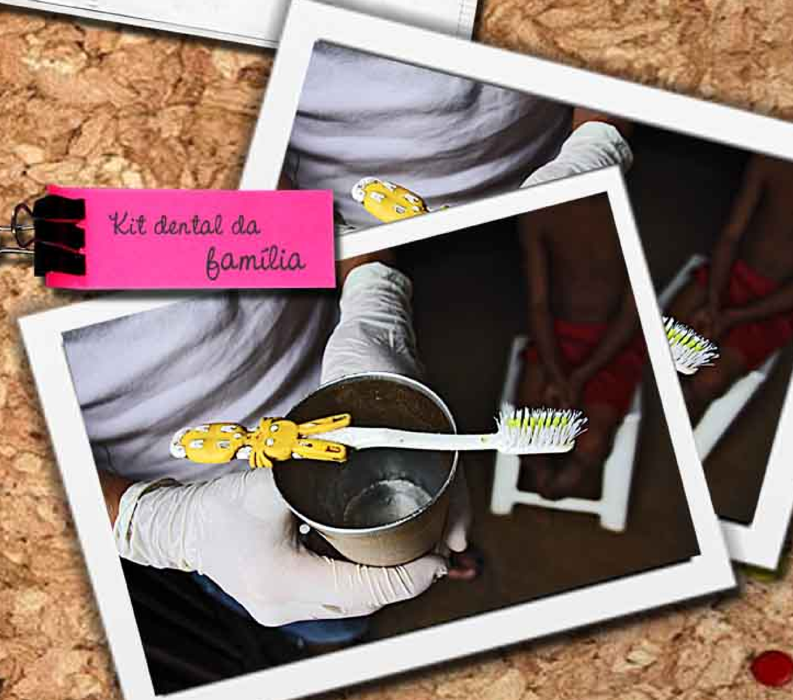
Kit dental da família