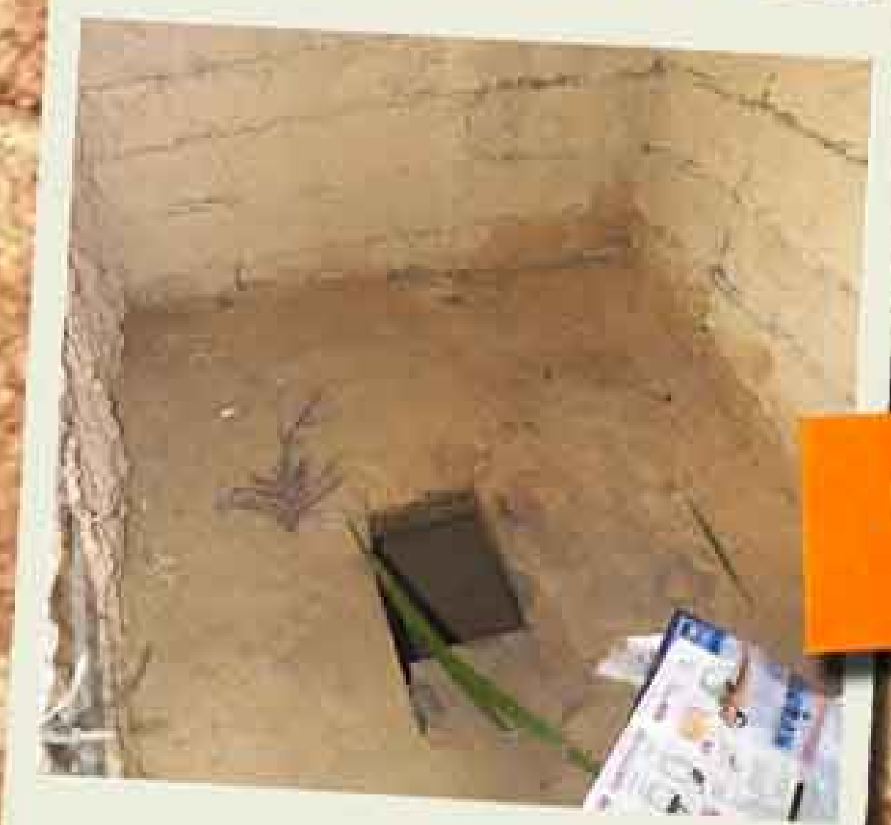
lado de dentro do banheiro