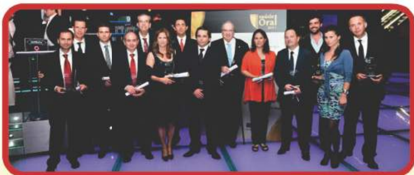
TdB e os demais vencedores do Prêmio Saúde Oral 2011.

A TdB foi destaque da 2ª edição do Prêmio Saúde Oral em Portugal. Promovido pela revista Saúde Oral, o evento visou premiar as melhores práticas da Odontologia portuguesa.