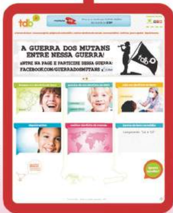
Home do novo site da TdB.

Outra novidade é o site www.turmadobem.org.pt , escrito em português lusitano e atualizado pela equipe da TdB com informações exclusivas sobre o projeto em Portugal. O site também conta com versões em Espanhol e Inglês.