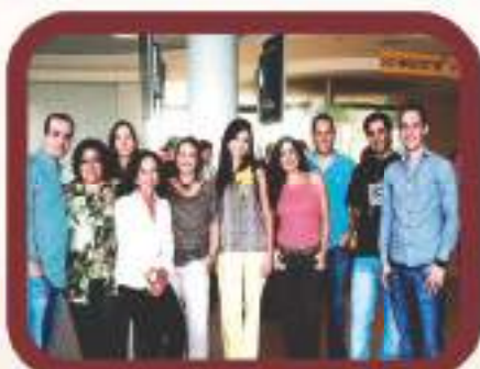
Coordenadores portugueses durante o SdB.