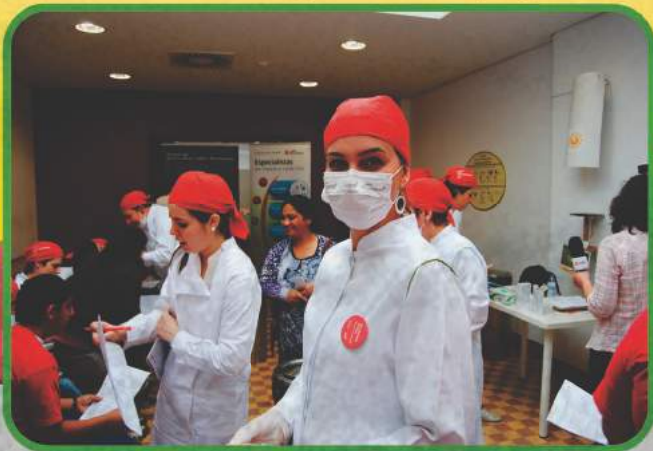
240 crianças foram selecionadas na Megatriagem.