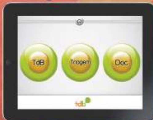
Destaque do aplicativo para iPad.

Aproveitando a oportunidade de homenagear os destaques da maior rede de voluntariado especializado do mundo, a TdB iniciou um projeto que pretende transformar seus processos a partir de 2012. Os Embaixadores receberam, em comodato, um iPad cada. Graças a isso, a partir de 2012 a TdB colocará em prática um projeto piloto que visa acelerar o tempo de encaminhamento dos beneficiários.