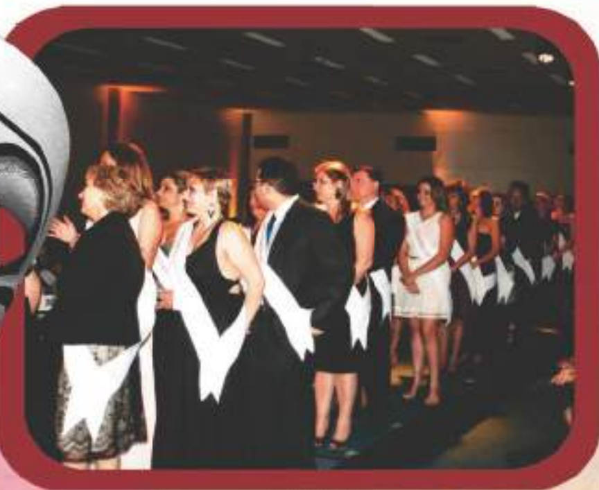
Cerimônia de nomeação dos Embaixadores TdB.

Como em 2010, os 50 coordenadores que mais se destacaram em 2011 foram nomeados Embaixadores TdB, em um jantar de gala que aconteceu durante o Sorriso do Bem.