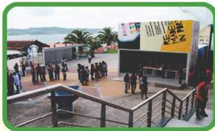
Megatriagem realizada em Lisboa no Museu da Eletricidade.