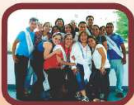
Coordenadores latinos durante o SdB.

Em 2011, estiveram presentes no Sorriso do Bem 17 coordenadores da América Latina. A TdB recebeu representantes de Argentina, Bolívia, Chile, Colômbia, Equador, México, Panamá e Peru. Já de Portugal vieram nove coordenadores: quatro de Lisboa, dois do Porto, um de Amadora, um de Beja e um de Cascais.