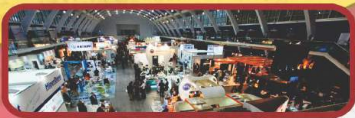
O Congresso da OMD é um dos principais eventos da odontologia portuguesa.

A TdB esteve no XX Congresso da Ordem dos Médicos Dentistas que aconteceu no Centro de Congressos de Lisboa, nos dias 10, 11 e 12 de Novembro de 2011, apresentando o projeto DENTISTA DO BEM durante uma sessão sobre Responsabilidade Social em Medicina.