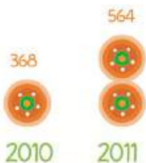
Dentistas na Rede