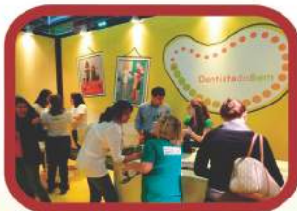
Estande da TdB no CIORJ 2011.

A TdB participou do CIORJ 2011, com estande próprio, desenhado pelo designer Thiago Heir. Ao longo dos quatro dias do evento, foram abertas 320 novas vagas.