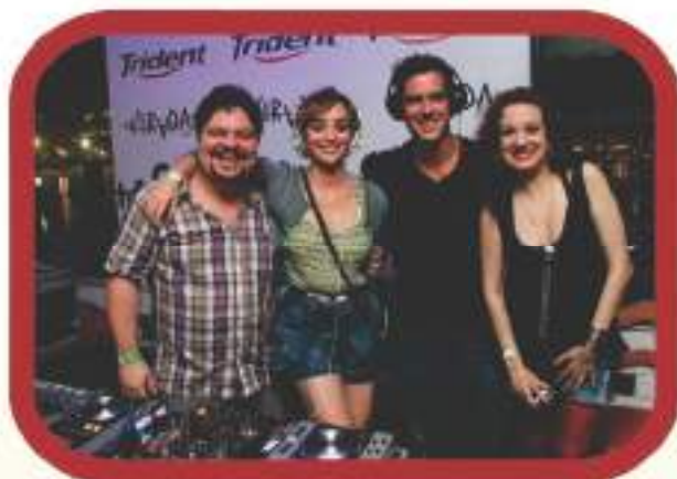
Famosos durante a festa.