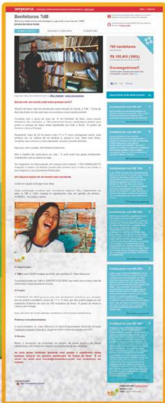
Plataforma que permitiu a campanha de mobilização.

Durante o Sorriso do Bem 2011 a TdB lançou um desafio para os coordenadores dentistas: buscar Benfeitores que, através de suporte financeiro, viabilizassem o atendimento de mais 1000 jovens em 2012 (atingindo assim 26mil beneficiários).