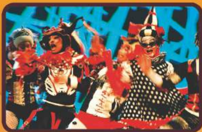
Número do Grupo Tholl durante a premiação.