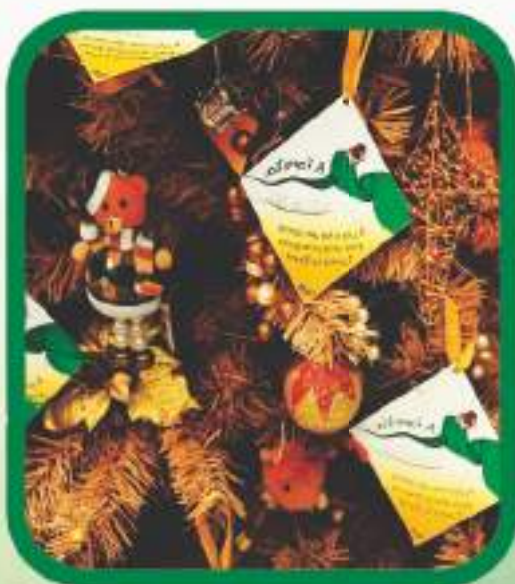
Árvore da ação de Natal.

No final de 2011 a TdB promoveu uma ação especial de natal nos restaurantes Rodeio e Marakuthai, ambos localizados em São Paulo. O objetivo da campanha foi captar recursos para a organização e apresentar as nossas causas para a sociedade.