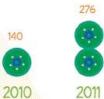
Dentistas na Rede