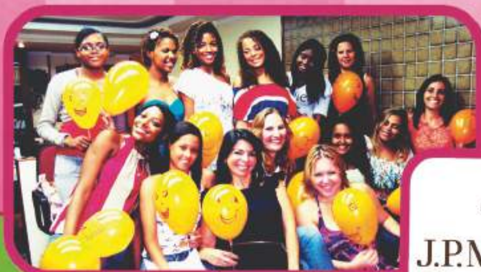
Coordenadoras cariocas com seus tutorandos

O curso tem carga horária total de 600 horas de aulas teóricas e 60 horas de estágio. Na grade curricular estão as disciplinas de Biossegurança, Administração, Auto-cuidado e treinamento em todas as áreas da Odontologia (Prótese, Dentística, Endodontia, Periodontia, Cirurgia, Anatomia, Radiologia e Odontopediatria).