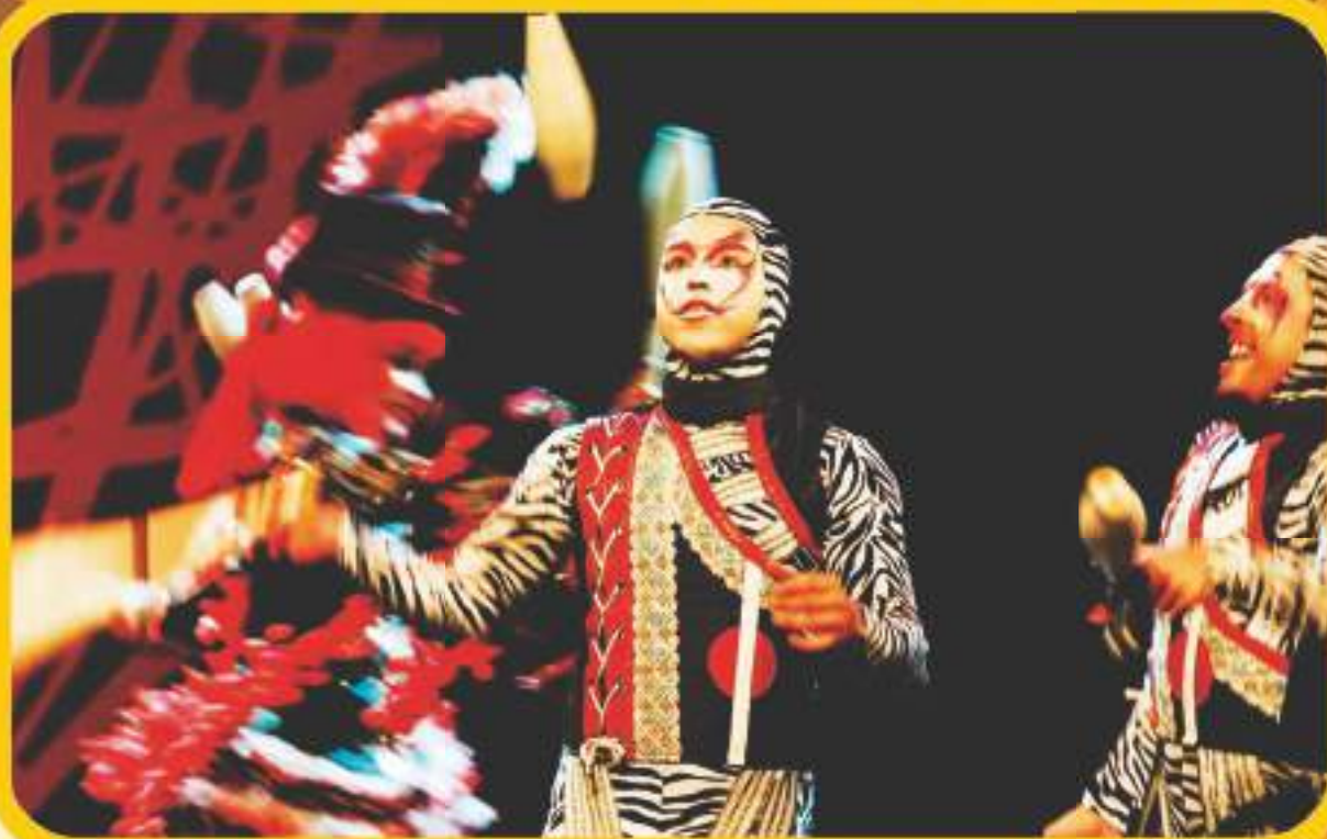
Grupo Tholl durante cerimônia de Premiação.